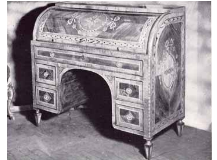
Fig. 4 – Manifattura milanese, scrivania con alzata, già collezione Anna Piatti