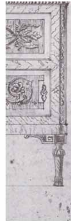
Fig. 3 - Particolare di un disegno raffigurante un progetto per cassettoni, Fondo Maggiolini, Milano, Castello Sforzesco