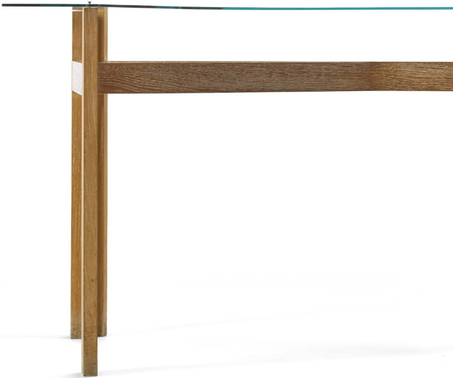
particolare del lotto 44