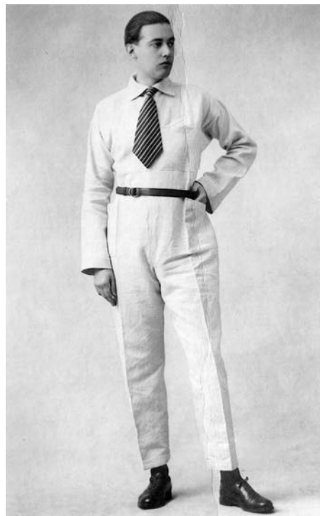
Ernesto Michahelles in arte "Thayaht" tra il 1922 e il 25 che indossa una versione della sua "Tuta".

L'opera presentata in questa vendita fu esposta alla Biennale di Monza del 1927 ed era stata concepita per il negozio Macy's di New York per una produzione limitata, che non fu mai avviata.