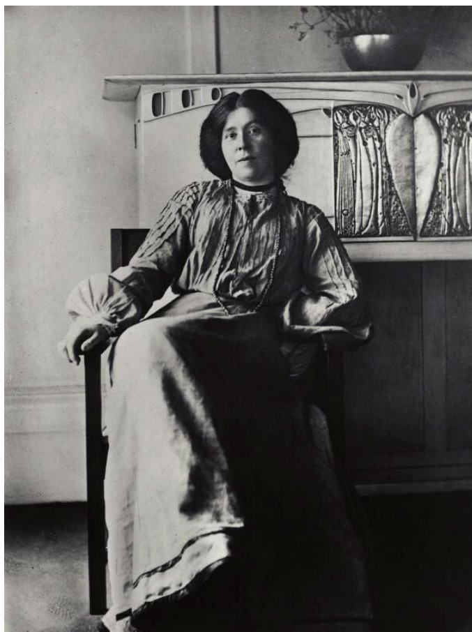
Margaret Macdonald Mackintosh, di James Craig Annan, stampa moderna al bromuro d'argento, 1901 ca. Immagine di pubblico dominio

This illustrated book consisted of a dozen or so watercolours, painted on vellum with each page incorporating a threaded ribbon surrounding a text from the Bible and an image in watercolour. These images retained the format of earlier works such as the fingerplates and posters produced around 1895-6, essentially vertical with elongated figures overlapping each other, but softened into more naturalistic human forms, more suited to the