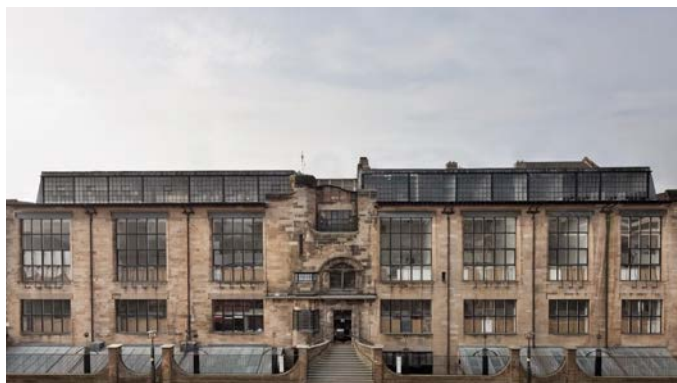
L'intera facciata nord della Glasgow School of Art di Mackintosh, scattata prima dell'incendio del 2014.