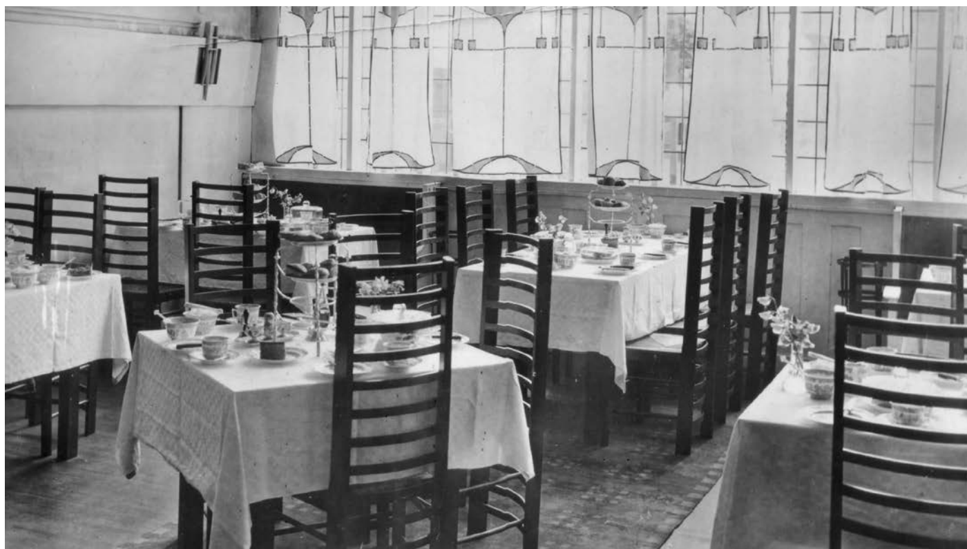
The Willow Tea Rooms

Questo libro è illustrato da una dozzina di acquerelli dipinti su pergamena, dove ogni pagina incorpora un nastro filettato avvolto attorno a un testo della Bibbia. Le immagini mantengono le proporzioni allungate e la composizione verticale delle opere precedenti, come le targhette e i manifesti prodotti intorno al 1895-96, con figure che si sovrappongono l'una all'altra, ma si distaccano dalle figure inquietanti del 1893-95 per i lineamenti umani addolciti e più naturalistici, adatti all'iconografia richiesta dal soggetto. Le sorelle scelsero proprio due episodi di questa storia della Nati-