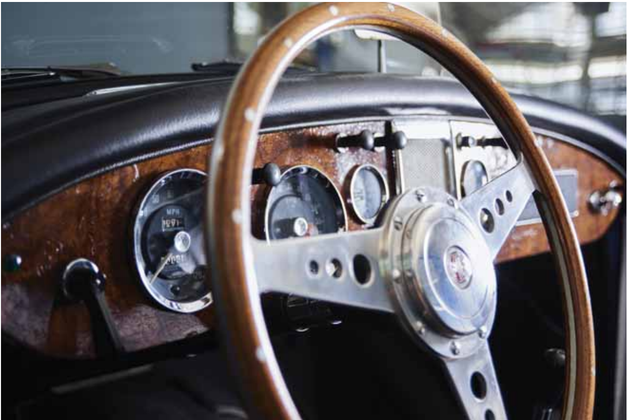
Interno del lotto 887