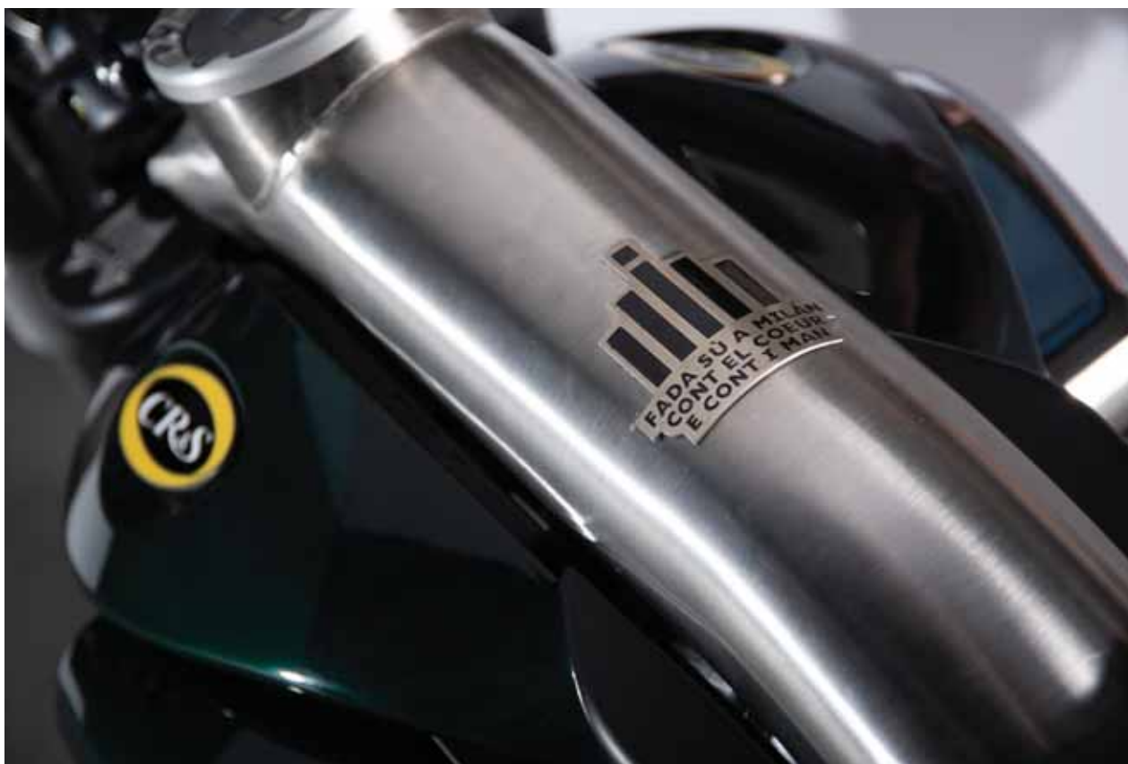
Dettaglio del lotto 889

Il dialetto Milanese viene scelto come la lingua ufficiale della CR&S e il motto, "Fada su a Milan cont el coeur e cont i man", è riportato su tutte le moto con un simbolo stilizzato del Duomo.